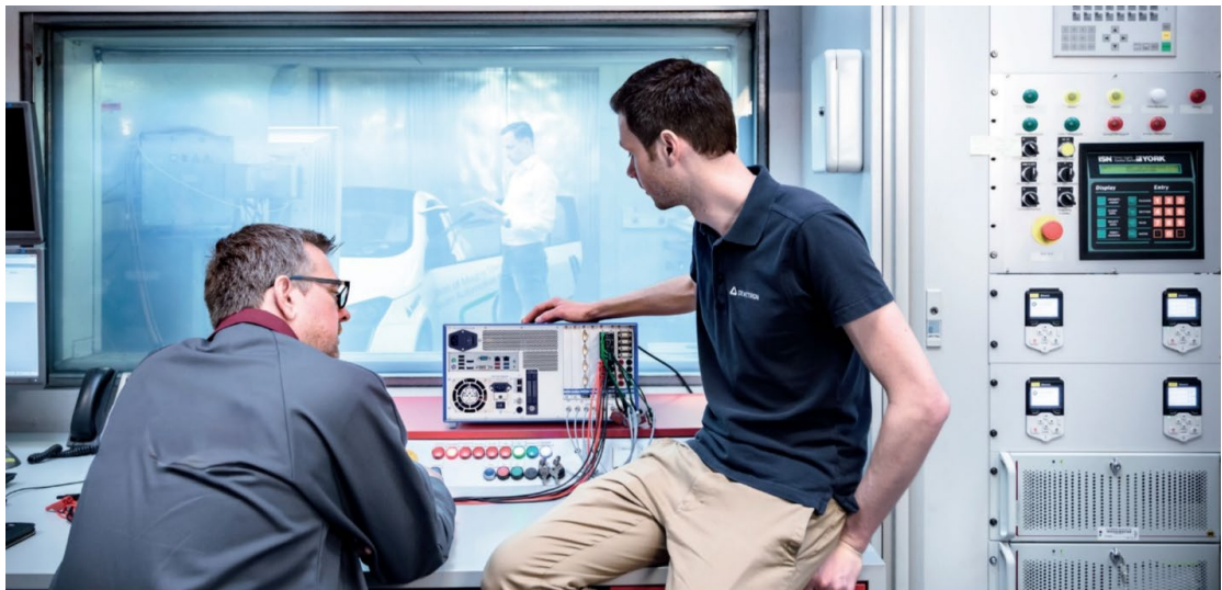
图 1 数据采集设备工作图

数据采集系统（Data Acquisition System，简称 DAQ）是用于收集、处理和传输数据的技术设备。它通过传感器、仪器和其他数据输入装置，从物理或环境源获取数据，并将这些数据转化为数字信号，以便进行分析、监测或控制。数据采集系统的目标是提供高效、准确的实时数据，帮助企业和组织做出更好的决策。